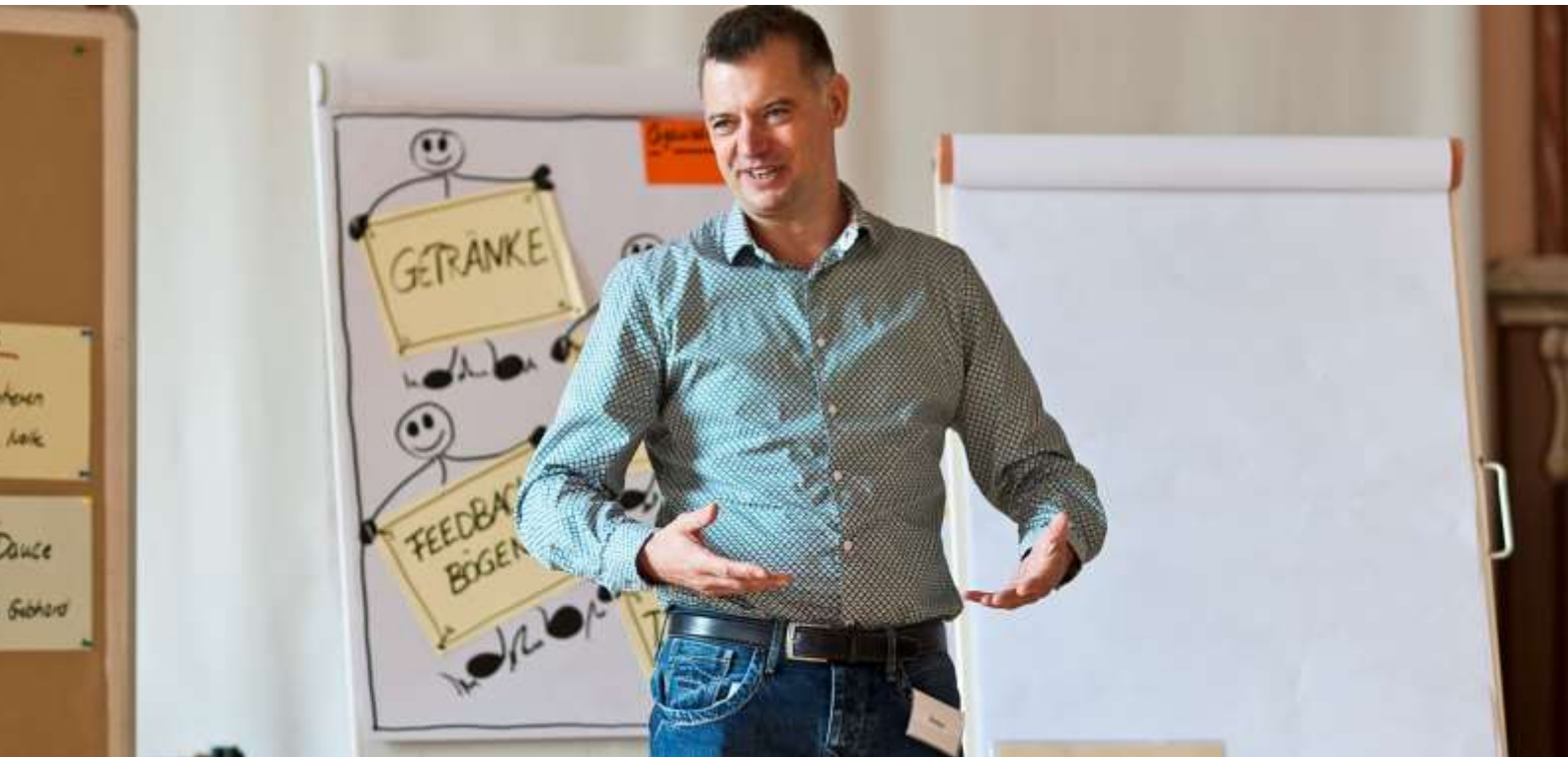
ABB – IMPULSTAGE IM KONTAKT MIT DEN ABSOLVENTEN