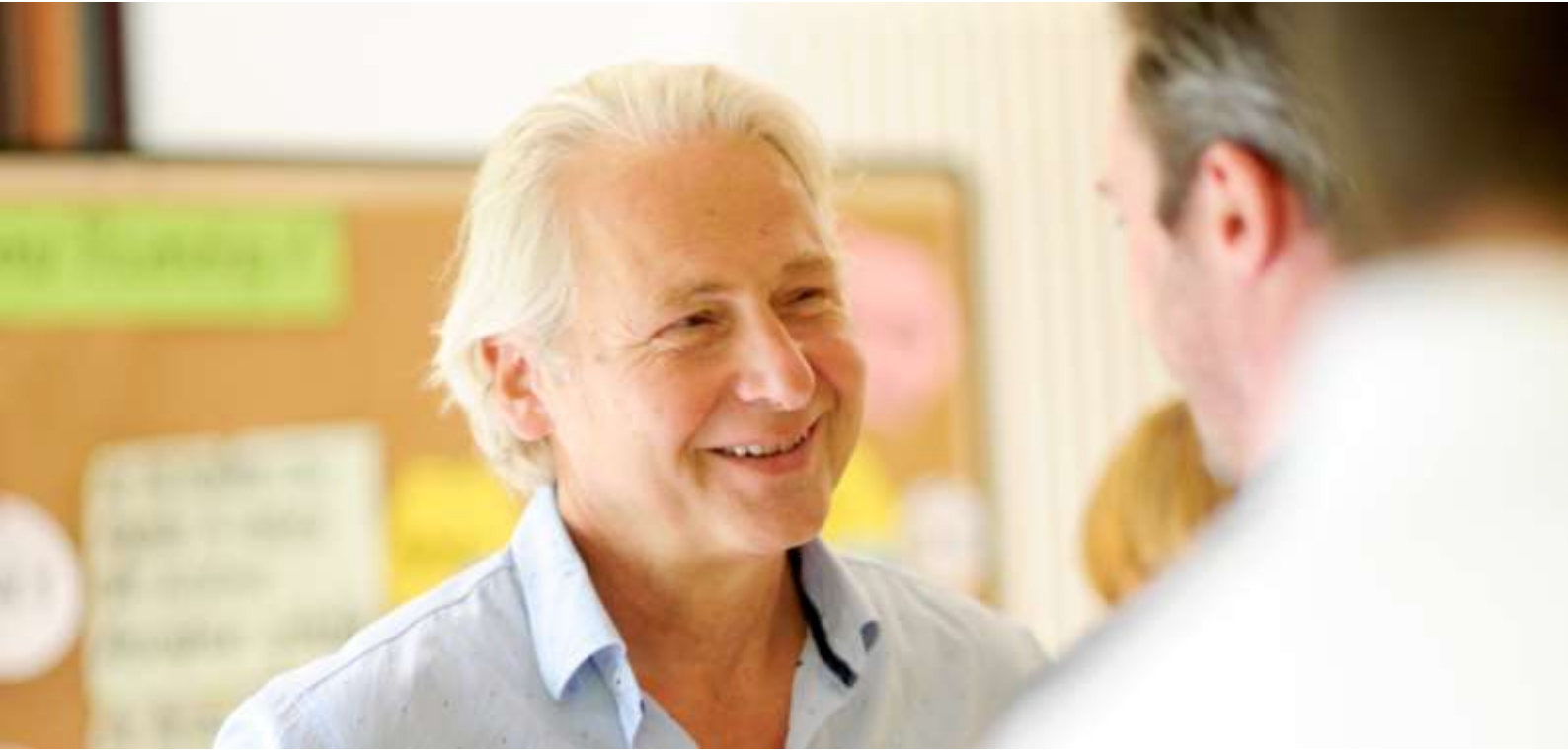
ABB-IMPULS-TAGE IM KONTAKT MIT DEN ABSOLVENTEN