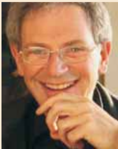
Lucas Derks “Das soziale Panorama”

Er entwickelte das Modell des sozialen Panoramas und leistete damit einen wesentlichen Beitrag zur Erweiterung des NLP um systemische Sichtweisen.